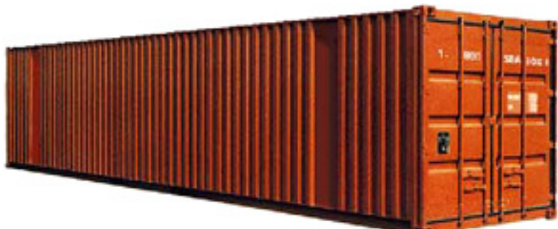
40-к. футовый стандартный контейнер

Размеры (длина × ширина × высота): 12192 mm × 2440 mm × 2700 mm Вес (с грузом): 30000 kg Вес (пустой): 2292 kg Объем: 127.7 m³