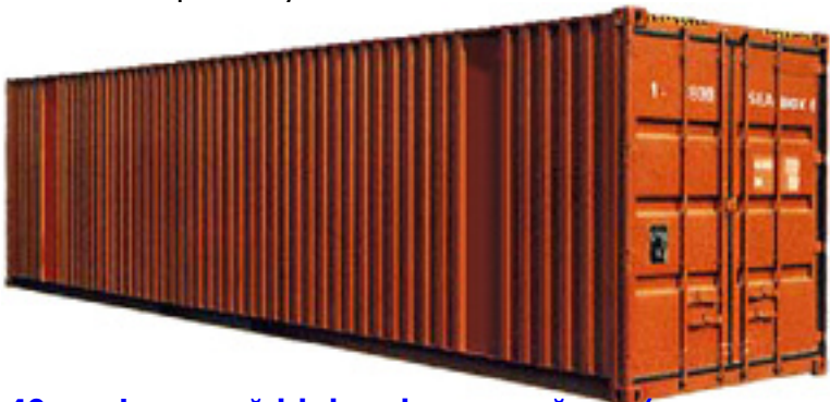
40-к. футовый high cube контейнер (увеличенной вместимости)

и вес порожнего контейнера могут существенно изменяться в зависимости от производителя.