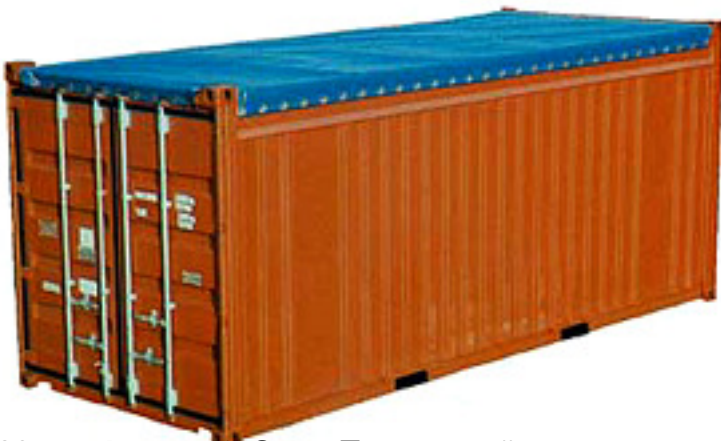
20-футовый Open Top контейнер Вес нетто (объем) 2335 mm

и вес порожнего контейнера могут существенно изменяться в зависимости от производителя.