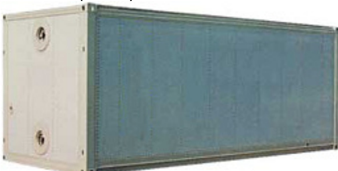
20-футовый герметичный контейнер Вес нетто (объем) 45000 kg

и вес порожнего контейнера могут существенно изменяться в зависимости от производителя.