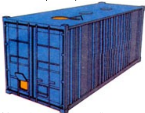
20-ти футовый контейнер для насыпных грузов

и вес порожнего контейнера могут незначительно изменяться в зависимости от производителя.