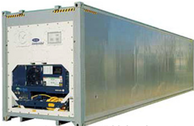
40-футовый high cube рефрижераторный контейнер Вес нетто (объем) 30480 kg