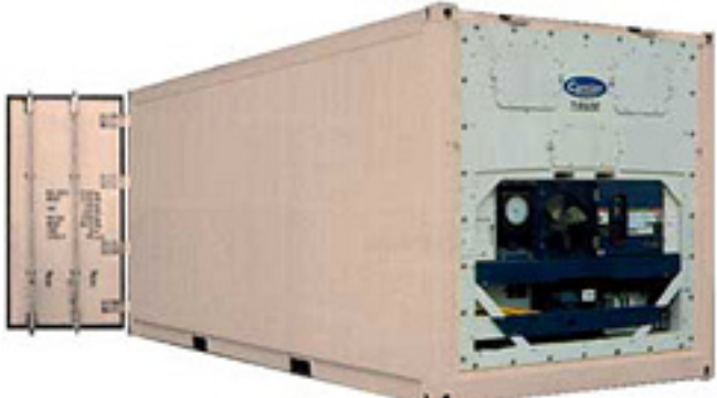
20-ти футовый рефрижераторный контейнер

и вес порожнего контейнера могут существенно изменяться в зависимости от производителя.