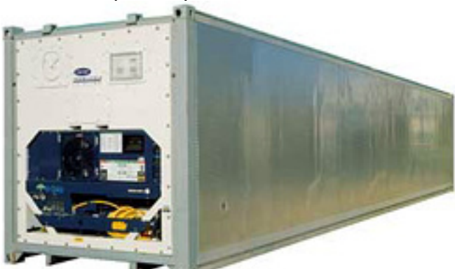
40-к. футовый рефрижераторный контейнер

и вес порожнего контейнера могут существенно изменяться в зависимости от производителя.